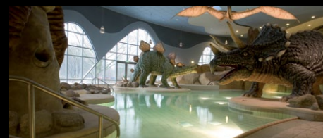
Festland - Bäderland, Hamburg

LTU Arena Düsseldorf | Futbalový štadión | Hyatt Regency Hotel, Trinidad | Plavecký bazén | Krytý bazén | Vonkajší bazén | Aquapark Festland, Hamburg | Plavecký bazén | Päťhviezdičkový hotel Sv. Truskavec, Ukrajina | Bazén | Krytý bazén | Kúpalisko | Rehabilitačné centrum, psychiatrická klinika, Schwerin | Nemocnica | Klinika | Liečebné sanatórium | Zoo, Landau | Vodné nádrže | Sanácia prístavu Iljičivsk, Ukrajina | Prístav Hydroizolácia jedálne a kantíny, Stryj, Ukrajina