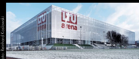
LTU Arena, Düsseldorf