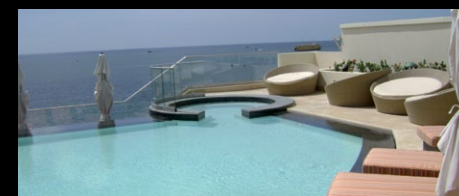
Hyatt Regency Hotel, Trinidad