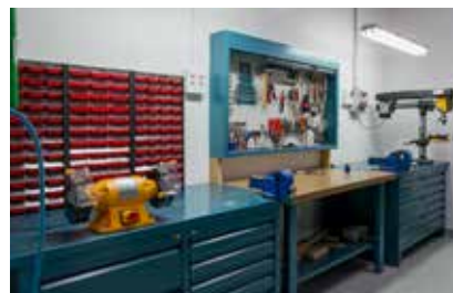
Plochy pre remeselné prevádzky