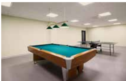
Vedľajšie a hobby miestnosti

Mechanicky namáhateľné a ľahko udržiavateľné plochy sa dajú zhotoviť pre rôzne oblasti použitia.