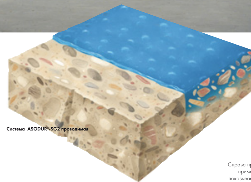
Система ASODUR®-SG2 проводимая

Высокие показатели прочности: Прочность на сжатие - ок. 80 Мпа Прочность на изгиб - ок. 30 Мпа Прочность сцепления > 3,0 Мпа