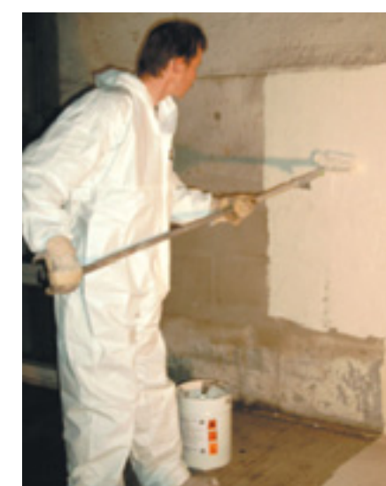
Пример нанесения ASODUR®-SG2-thix на стену