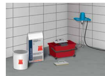
2 CRISTALLFUGE et outillage nécessaire