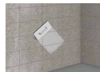
6 Retrait de l'excédent par un raclage en diagonale