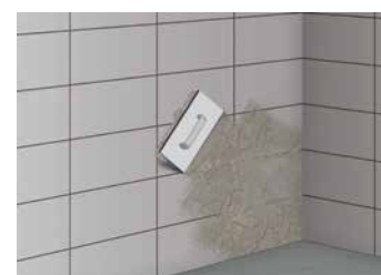
5 Application du mortier de jointoiment