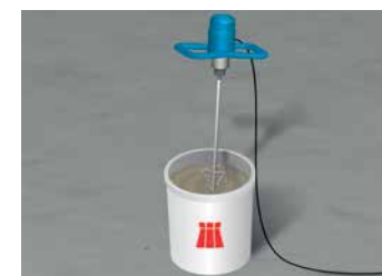
4 Malaxage du mortier