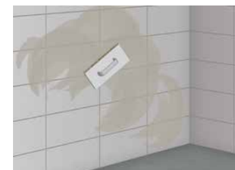
8 Après la prise, émulsionner le mortier