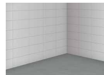
10 Mur jointoyé, terminé!