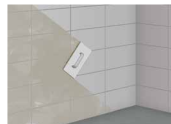
9 Nettoyage de la surface, en diagonale par rapport aux joints