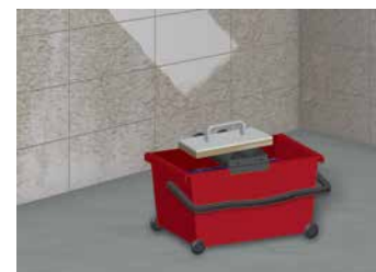
7 Humidifier puis essorer une taloche éponge propre