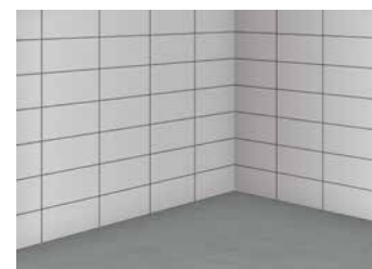
1 Mur à jointoyer, prise de la colle terminée