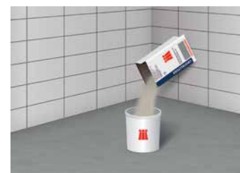
3 Verser la poudre dans un seau propre